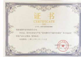
环境保护产业协会证书